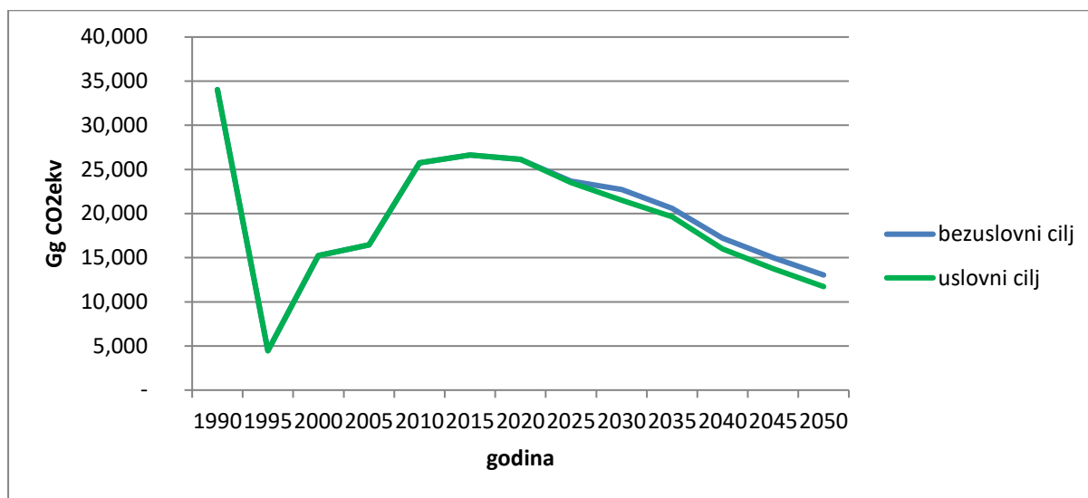
Slika 3: Emisije GHG-a u BiH do 2050. godine prema ciljevima smanjenja emisija

Slika 3 prikazuje emisije GHG-a od 1990. do 2050. godine prema prethodno opisanim ciljevima. Emisije do 2014. godine su preuzete iz inventara, a emisije od te godine pa do 2050. su modelirane u LEAP-u, imajući u vidu mjere po pojedinim sektorima.